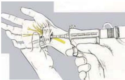
Man kommer hurtigere i gang efter en kikkertoperation.

Sygefraværet bliver således omtrent halveret afhængigt af, hvilket arbejde man har. Gevinsten er endnu større, hvis man har symptomer på begge sider, idet man med den mere skånsomme teknik kan tillade sig at operere begge hænder på én gang.