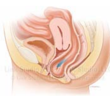
Nedsynkning bagerste del af skeden

Livmoderhalsen, forreste eller bageste del af skeden eller en kombination af disse kan presse sig frem gennem skeden i større eller mindre grad.