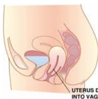
Nedsynkning af livmoder